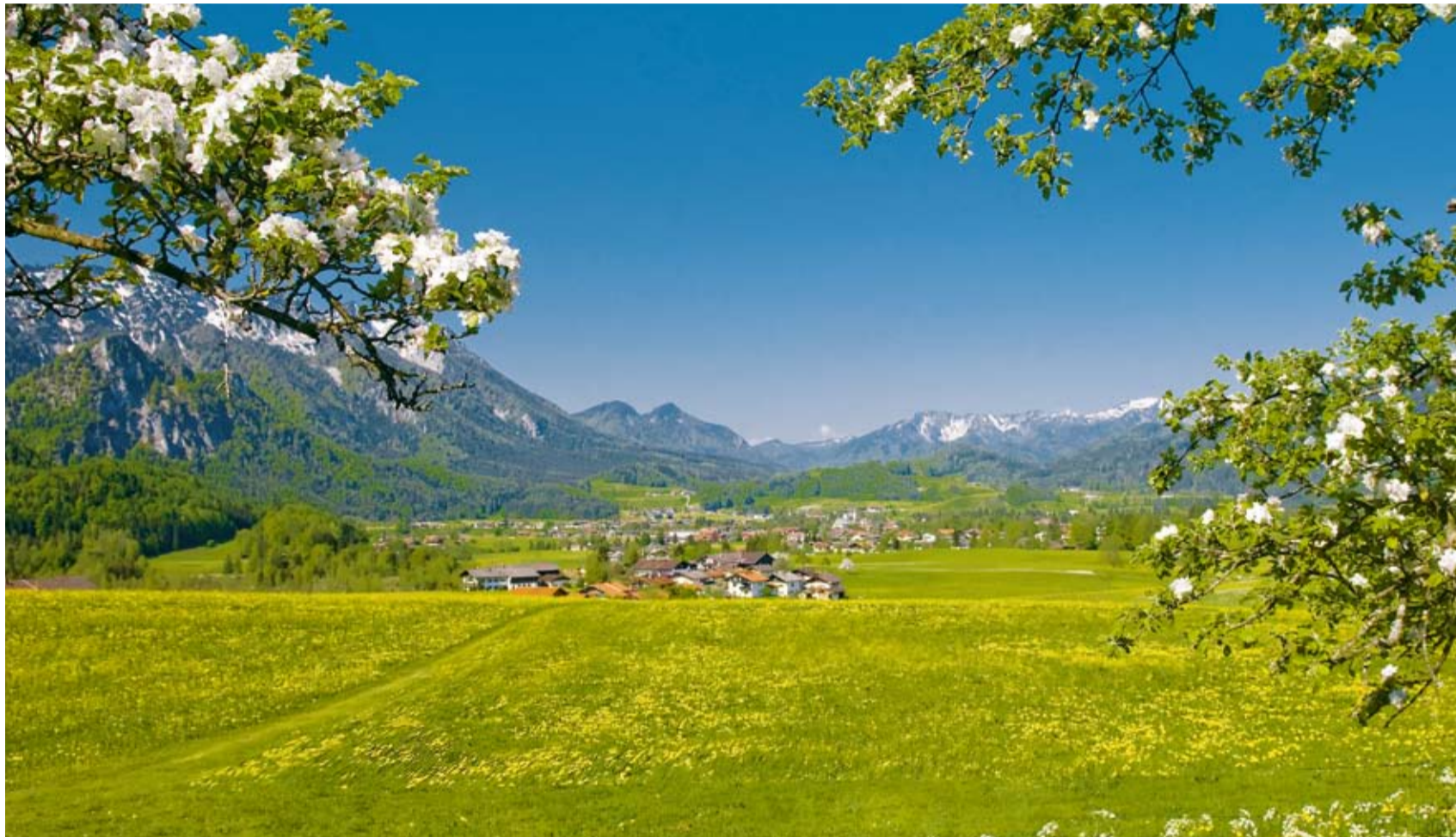
Frühling in Inzell – blühende Obstbäume, bunte Wiesen und verschneite Berggipfel.

Alle Informationen für Ihren Urlaub in Inzell