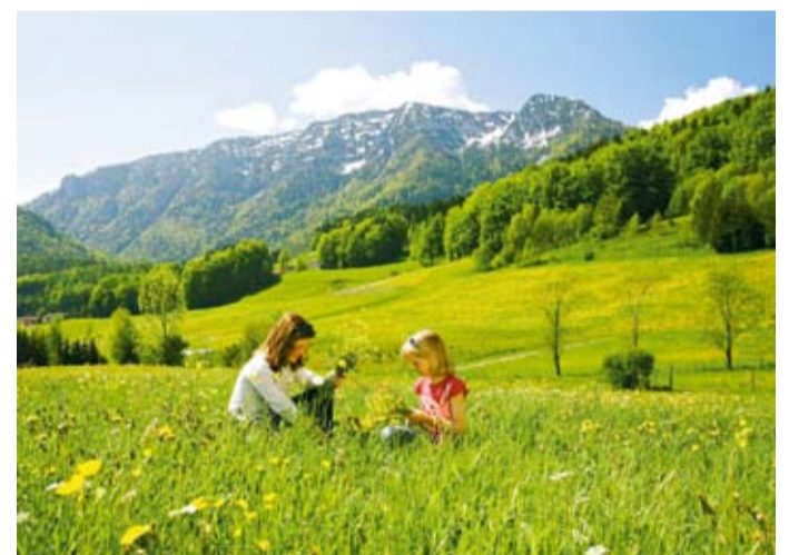
Besonders Kinder freuen sich über das bunte Blumenmeer.

Ball- und Spielplätze oder Offroad-Modellbahn“, zählt Birgit Thanner vom Gästeservice der Inzeller Touristik GmbH auf, „Wir haben für jeden etwas im Programm.“ Und nach einem erlebnisreichen Aktivtag gönnen Sie sich einfach einen Tag zum Wohlfühlen. Blockhaussauna, osmanisches Dampfbad oder römische Dampfsauna versprechen pure Entspannung und beim Qi Gong können Sie die Seele baumeln lassen. Eine Fußreflexzonenmassage macht win-