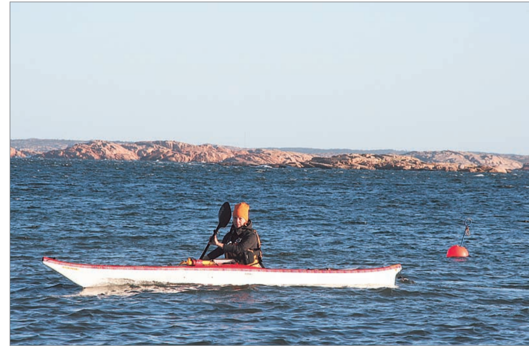
Mit dem Kajak lässt sich die Schärenwelt vom Wasser aus erkunden. Die Halbinsel Ramsvik ist ein guter Ausgangsort für Touren.