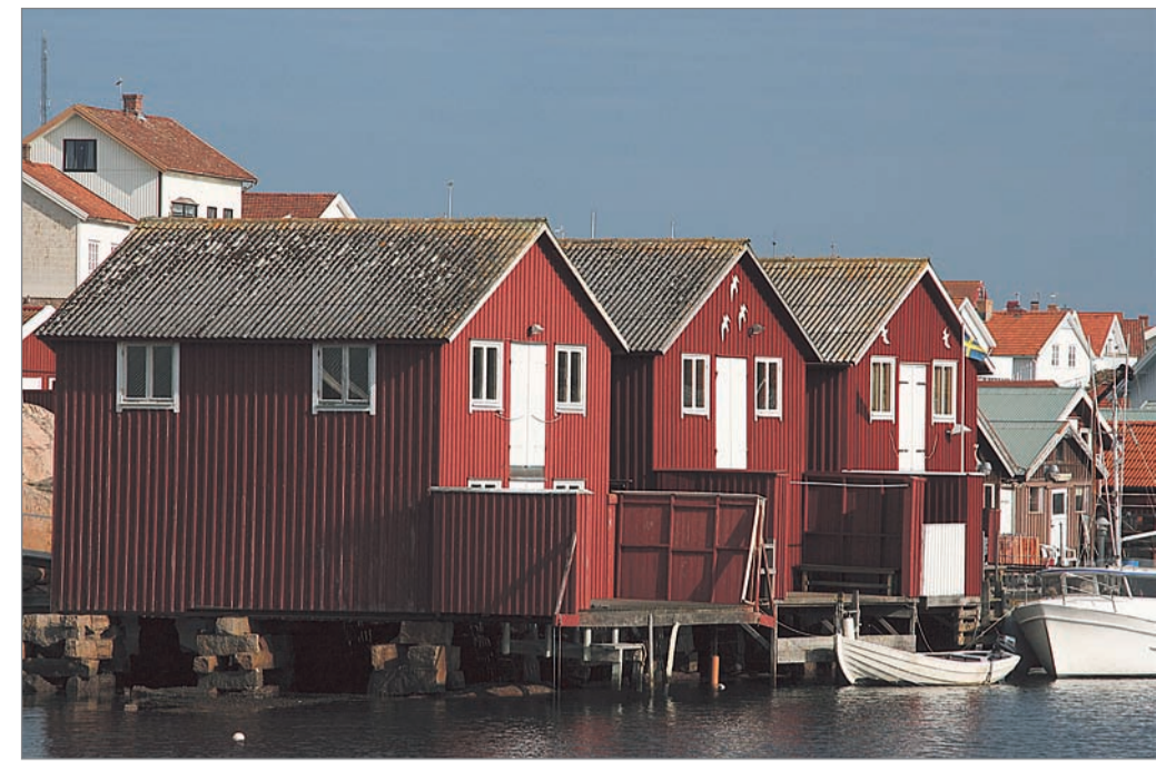
Die kleinen bunten Ferienhäuschen, wie hier in Smögen, sind typisch für Schwedens Küstenorte.