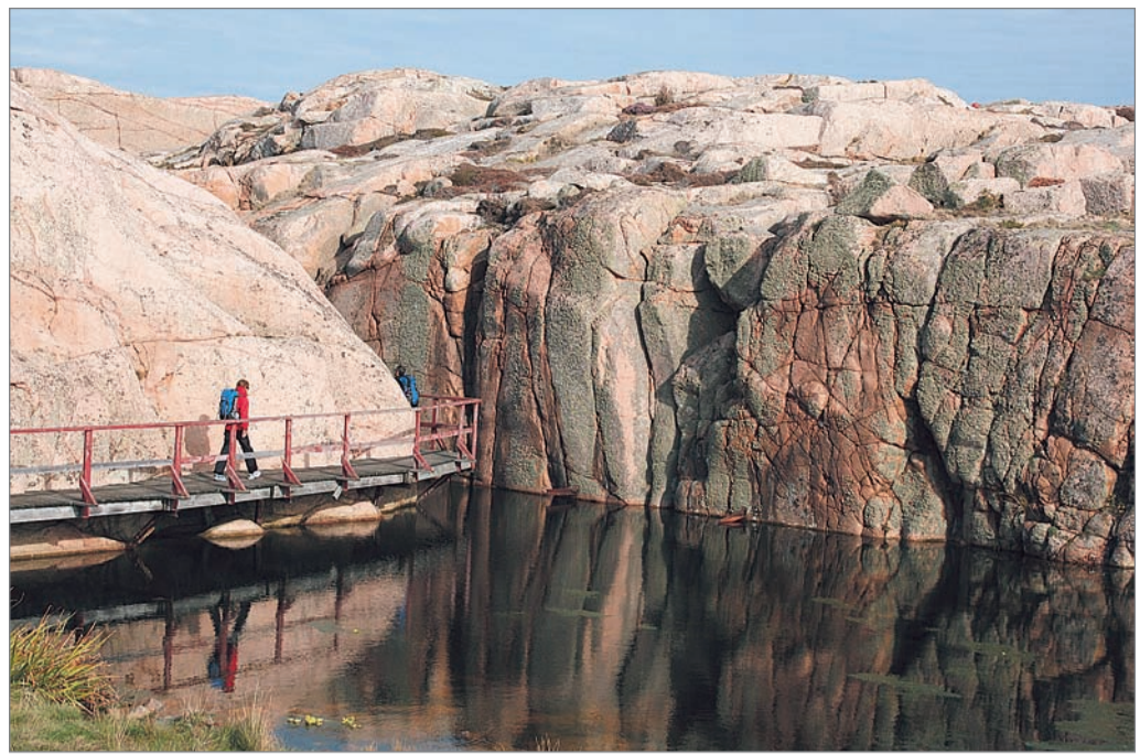
Die rosaroten Granitfelsen in den Schären von Bohuslän sind von der Eiszeit, dem Wind und Wasser glatt geschliffen.